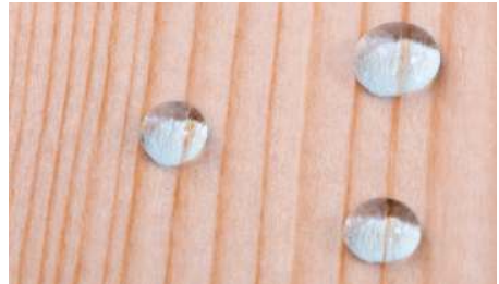
Hout behandeld met WOODSEAL PRO